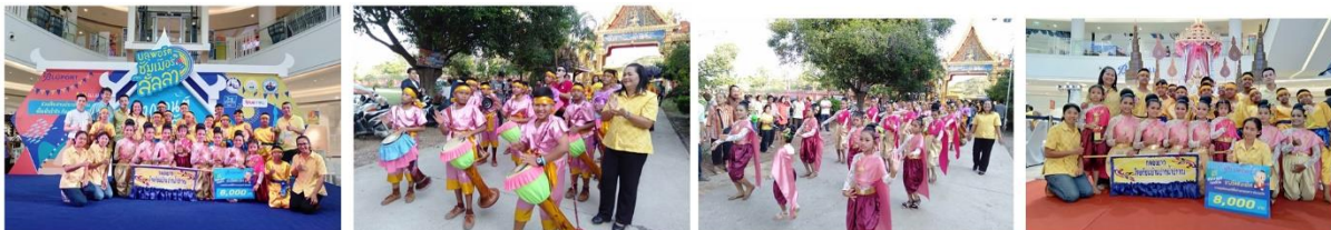
ภาพที่ 2 การแสดงศิลปวัฒนธรรมสู่ชุมชน (นาฏศิลป์-กลองยาว) โรงเรียนบ้านปากน้ำปราณ

การประเมินผลผลิตของโครงการการบริหารจัดการแบบมีส่วนร่วมด้านศิลปวัฒนธรรมสู่ชุมชน (นาฏศิลป์-กลองยาว) กับผู้ที่มีส่วนเกี่ยวข้องโดยรวมอยู่ในระดับมาก ( \bar{X} = 4.46 , S.D.= 0.71) พบว่า นักเรียนมีความรู้ความเข้าใจเกี่ยวกับศิลปวัฒนธรรมและภูมิปัญญาท้องถิ่นที่ดำเนินการอนุรักษ์โดยรวมอยู่ในระดับมาก ( \bar{X} = 4.44 , S.D.= 0.63) ครูและนักเรียนมีความเห็นสอดคล้องกันคือ โรงเรียนบ้านปากน้ำปราณ มีการดำเนินกิจกรรมอนุรักษ์ศิลปวัฒนธรรมตามโครงการ และสามารถส่งผลต่อการถ่ายทอดภูมิปัญญาท้องถิ่นได้โดยรวมอยู่ในระดับมากที่สุด ( \bar{X} = 4.59 , S.D.= 0.67) นักเรียนสามารถแสดงผลงานแบบมีส่วนร่วมด้านศิลปวัฒนธรรมสู่ชุมชน (นาฏศิลป์-กลองยาว) ได้อย่างมีคุณภาพและสามารถแสดงต่อสาธารณชนได้อย่างดีเยี่ยม ได้รับรางวัลต่าง ๆ มากมาย ครู นักเรียน และผู้ปกครองของนักเรียน มีความเห็นสอดคล้องกันคือ โรงเรียนบ้านปากน้ำปราณ ดำเนินกิจกรรมอนุรักษ์ศิลปวัฒนธรรม แบบมีส่วนร่วมด้านศิลปวัฒนธรรมสู่ชุมชน(นาฏศิลป์-กลองยาว) ซึ่งจะสามารถส่งผลต่อการเสริมสร้างลักษณะนิสัยของนักเรียนได้โดยรวมอยู่ในระดับมากที่สุด ( \bar{X} = 4.57 , S.D.= 0.66) และผลกระทบจากการดำเนินโครงการ ส่งผลให้ นักเรียนมีผลสัมฤทธิ์ทางการเรียนดีขึ้น ได้แสดงออกสู่สาธารณชนเป็นการเผยแพร่ผลงานและชื่อเสียงของโรงเรียน รู้สึกว่าตนเองมีคุณค่าทางสังคม เป็นที่ยอมรับของเพื่อน ๆ กล้าแสดงออกในสิ่งที่เหมาะสม และมีความรักในสถาบันตนเอง ชุมชนมีความรัก ชื่นชมในผลงานของนักเรียนที่นำไปแสดงในสถานที่ต่าง ๆ และผู้ปกครองนักเรียนมีความรักและศรัทธาต่อโรงเรียน